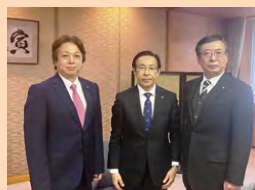
▲西脇隆俊府知事を表敬訪問。 吉本町長と共に地域の声をしっかりと届けます。