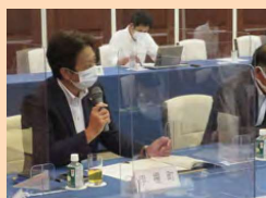
▶町村議長会主催の府政懇談会で西脇知事へ国道178号の強靱化、大学入学共通テストの丹後への試験会場設置等、直接要望させていただきました。