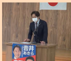
▶コロナ禍で書面決議等が続いておりました自民党伊根町支部総会を開催。引き続き、支部長の職を仰せつかりました。