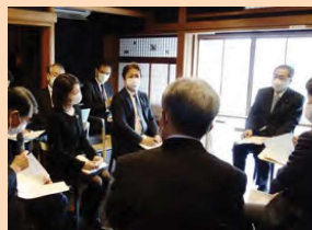
▲齊藤鉄夫国土交通大臣が来町！ 伊根町視察をアテンドし、宮津での車座会議に参加。 国道178号の強靱化、国内旅行の平日利用の促進、キャンペーン事務の簡素化について要望。