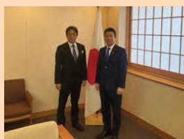
▶外務大臣政務官 本町太郎衆議院議員を表敬訪問。