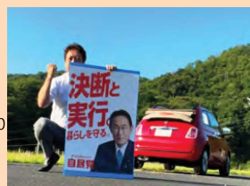
▶朝のご挨拶も270回を超えました。引き続き、政治に関心をもつて頂くため活動してまいります。