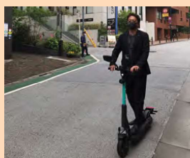
▲シェアサービス（電動モビリティ）の現地視察