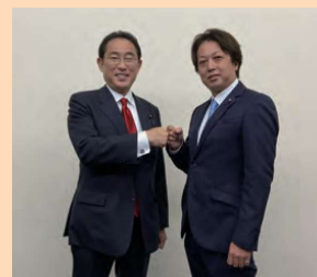
▲岸田総理来町（ふるさと対話集会in伊根）