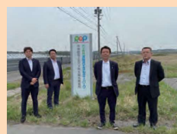
▲同志の町議の皆さんと日本原燃の六ヶ所再処理工場等を視察。